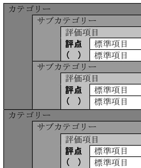
〔共通評価項目の階層イメージ〕

注)事業評価に用いる共通評価項目の場合 (カテゴリ-8は上記の階層構造とは異なります)